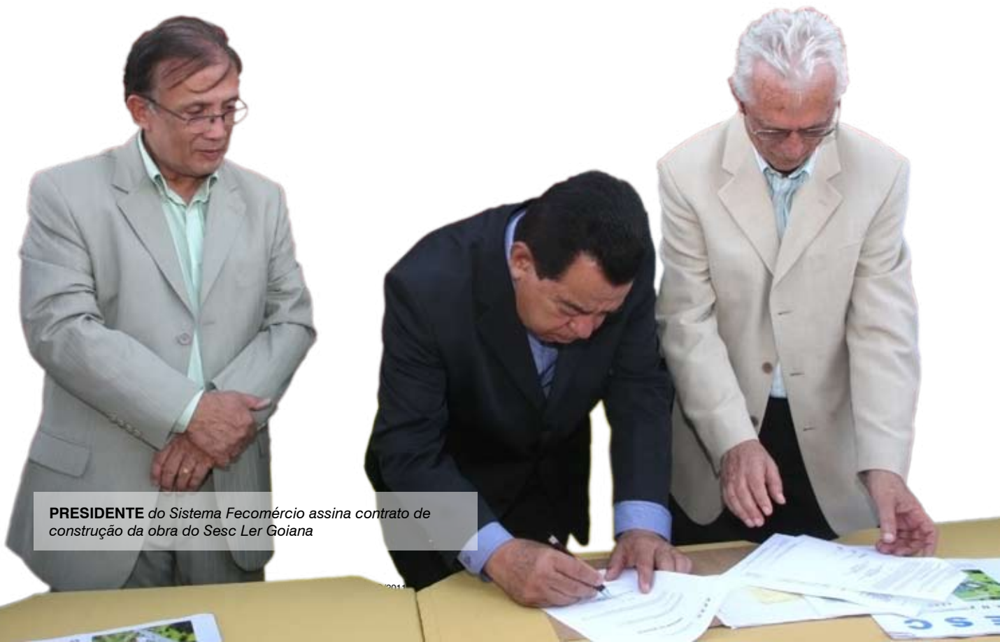
PRESIDENTE do Sistema Fecomércio assina contrato de construção da obra do Sesc Ler Goiana

no terreno do Sesc, que fica na Rua do Arame (Goiana), para marcar a assinatura do contrato com a construtora Sercol, vencedora da licitação para execução do projeto, que inclui salas de aula, ginásio de esportes, pátio de eventos, parque aquático, museu, biblioteca, teatro e cinema. A previsão de conclusão das obras é de dois anos. “Já foram aprovados R$ 17 milhões em investimentos para esta obra, fora o que está por vir. Essa é uma escola que vai beneficiar toda a população da cidade. O Sesc quer oferecer um trabalho de qualidade, pois a escola precisa atender bem a todos, sem distinção”, disse o presidente. E o prefeito da cidade, Henrique Fenelon, presente na ocasião, declarou: “Essa parceria com o Sesc permitiu tornar um sonho em realidade, trazendo cultura, educação e lazer para o povo de Goiana. Vamos ter o maior centro educacional do Estado de Pernambuco”.