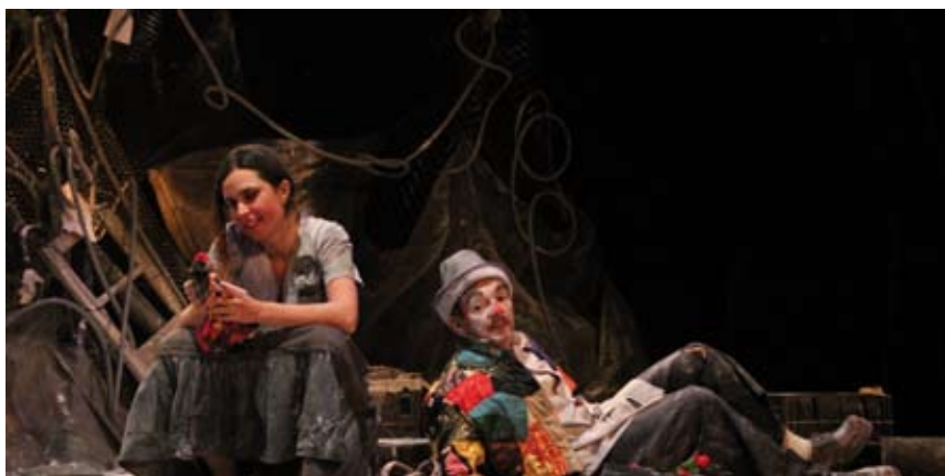
Grupo Fiandeiros está presente no encerramento do Aldeia

Durante os dez dias de evento, além das intervenções musicais, sessões de cinema, espetáculos