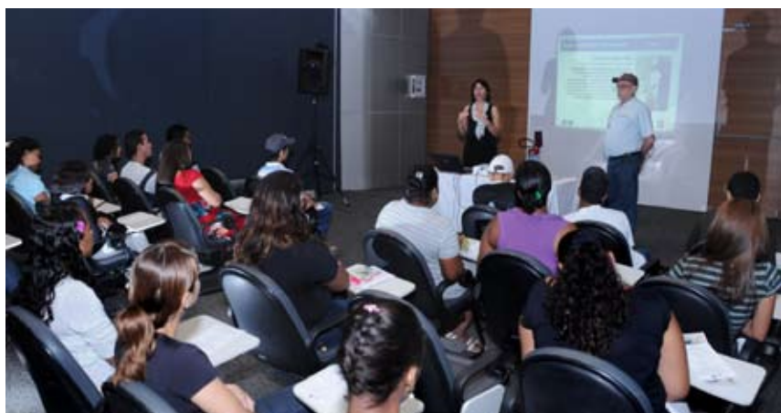
NA PARCERIA , está prevista a realização de palestras e workshops. Só na primeira etapa, 485 pessoas foram contempladas nestas ações.

Estão sendo oferecidas turmas de bombeiro civil, almoxarife, vendedor, auxiliar de limpeza, auxiliar de operações em logística, operador de caixa e formação de vigilante. Na primeira etapa da parceria, foram capacitadas 479 pessoas nos cursos de recepcionista, auxiliar administrativo, operador de caixa, operador de computador, vendedor, bombeiro civil, auxiliar de limpeza, montagem e manuten-